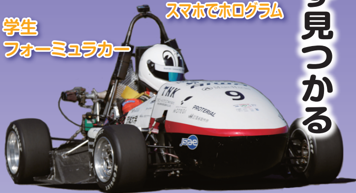
学生 フォーミュラカー