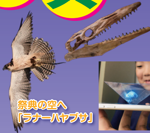
祭典の空へ 「ランナーハヤブサ」