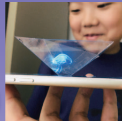
スマホでホログラム