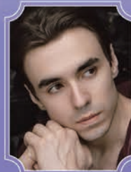
コスチャンチン・ツァプリカ