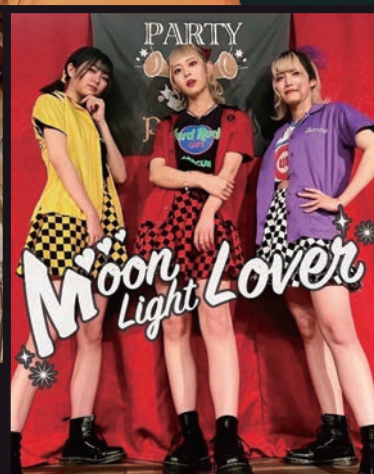
Moon Light Lover