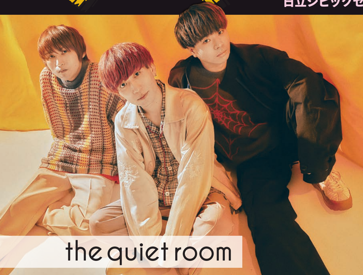
the quiet room

2024. 8.17 (SAT) OPEN 15:30 START 16:00 日立シビックセンター 多用途ホール